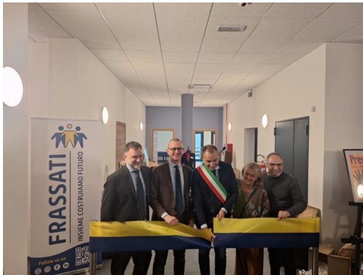
Il taglio del nastro del nuovo cohousing solidale

Spazi condivisi, servizi sociali e tecnologia nel nuovo complesso inaugurato in Circoscrizione 4